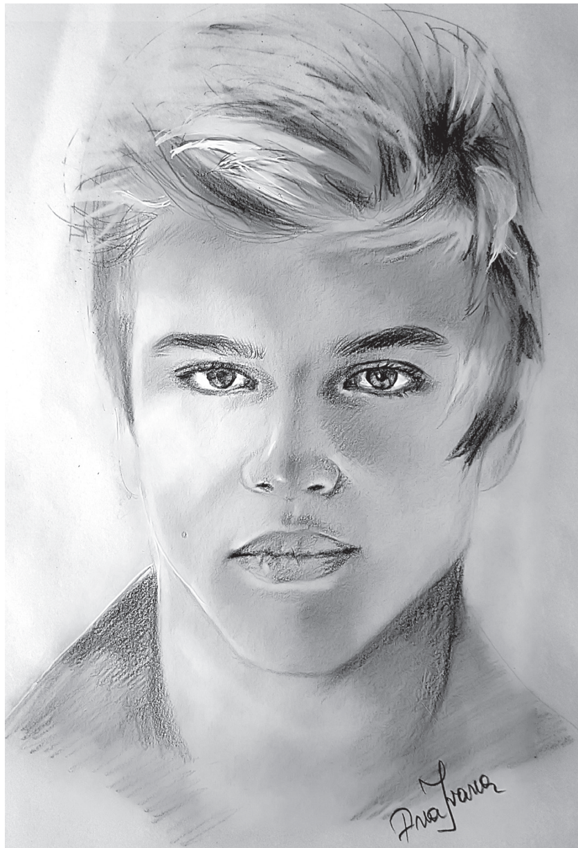
Tanis – Păr șaten-roșcat, tuns și aranjat într-o asimetrie senzuală, ochi de culoarea coniacului... Mda, perfect!